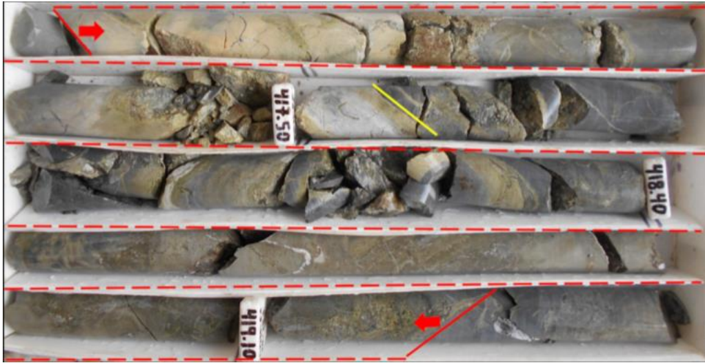
Minéralisation disséminée et de remplacement