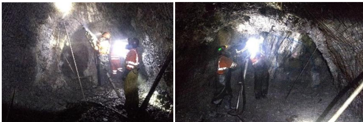
Test des perforateurs

A la suite de l'acquisition de nouveaux perforateurs à air comprimé, les tests effectués après leur mise en place ont été concluants. Ces perforateurs permettront de progresser dans le tunnel de manière plus efficace.