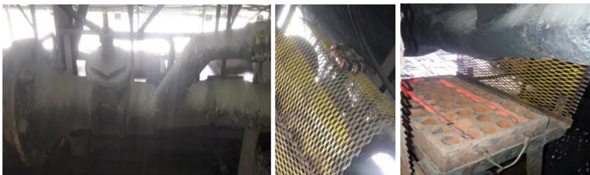
Système de chauffage

Après la mise en service en 2019 du convoyeur hélicoïdal permettant de sécher les concentrés et ainsi de diminuer leur taux d'humidité, un système de chauffage complémentaire a été installé au niveau du filtre. L'objectif est de diminuer au maximum l'humidité des concentrés permettant ainsi d'augmenter la quantité effective de concentré transportée par camion et donc optimiser les coûts logistiques.