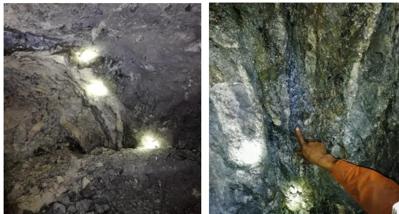
Veine E Angel niveau -185m

Les équipes minières ont poursuivi les opérations d'avancement de la rampe dans la mine d'El Santo atteignant le niveau -185 m. La veine El Angel, dont la continuité en profondeur avait été confirmée par les forages de 2019, a finalement été atteinte par la rampe en vue de l'extraction à venir.