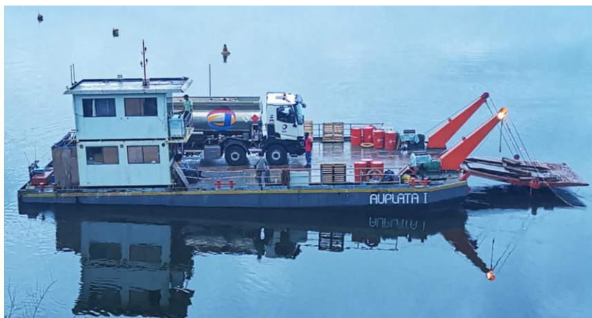
Approvisionnement de carburant – Citerne en convoi sur la Barge d'AMG