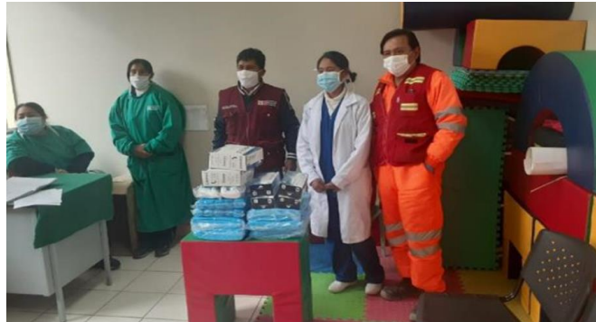
Remise des kits de protection

Des ateliers de prévention ont été organisés avec les communautés voisines des opérations afin de les sensibiliser sur les risques du COVID-19 ainsi que sur les précautions à adopter pour limiter la contagion. A cet effet, des kits de protection ont été distribués (gants chirurgicaux, masques etc.)